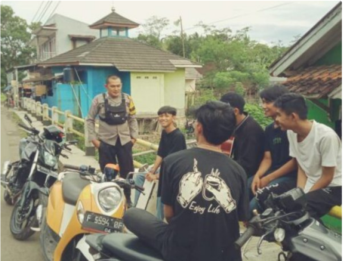
Polsek Cireunghas Polres Sukabumi Kota

Kota Sukabumi – Polres Sukabumi Kota Polda Jawa Barat – Polsek Cireunghas melaksanakan kegiatan dialogis dengan para pengemudi angkutan umum di jalan