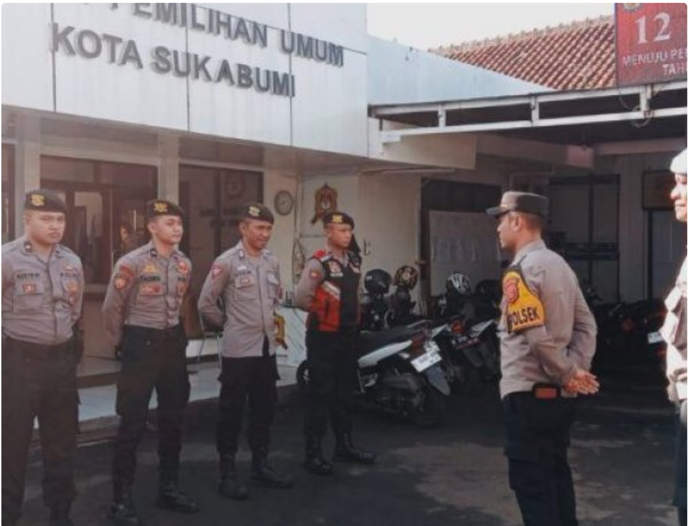
Polsek Citamiang Polres Sukabumi Kota

Kota Sukabumi – Polres Sukabumi Kota Polda Jawa Barat – Guna pastikan aman, Polsek Citamiang Polres Sukabumi Kota menempatkan personilnya untuk